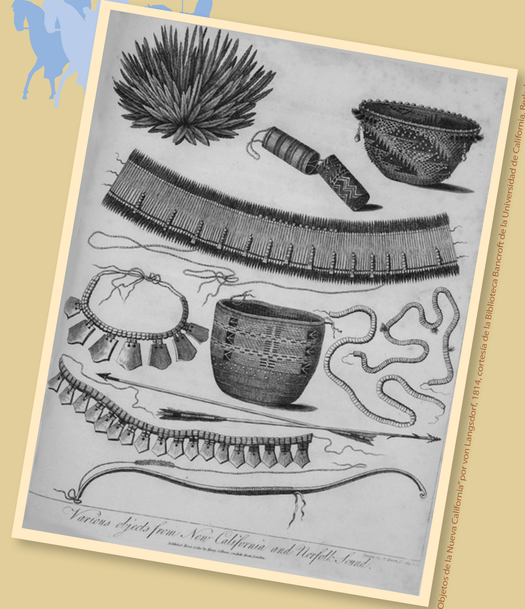
Objetos de la Nueva California por von Langsdorf, 1814

Los diarios de Anza y Font son de los pocos documentos que describen por experiencia propia la vida en la zona antes de la colonización española.